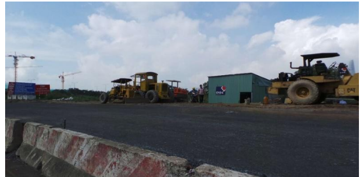
Thi công phối đá dăm đường R14