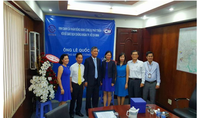
Ban điều hành CII và đoàn đại diện HOSE