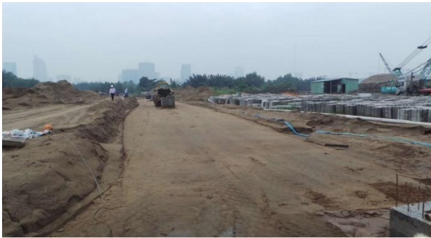
Thi công đắp cát đường R10