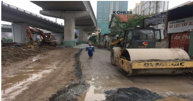
Thi công phối đá miên đoạn gần ga metro Rạch Chiếc