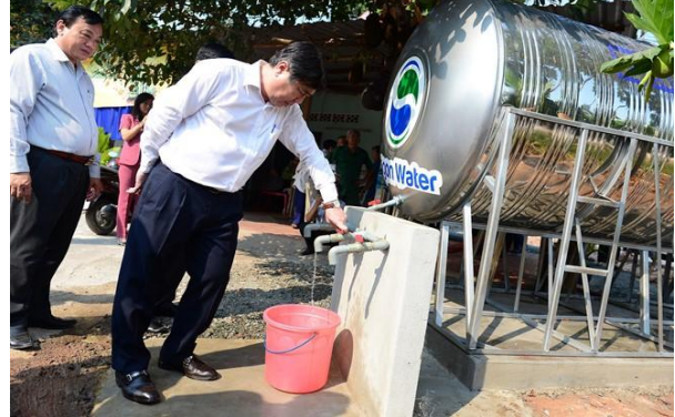
Chủ tịch UBND TP.HCM Nguyễn Thành Phong trong một lần thị sát dự án nước Củ Chi