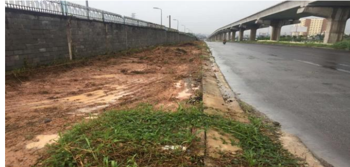
Đoạn trước nhà máy nước Thủ Đức đang được hoàn thiện