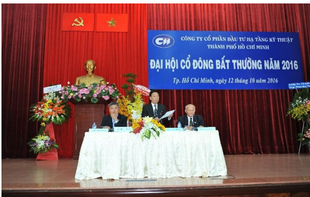
Chủ tọa đoàn trả lời câu hỏi của cổ đông