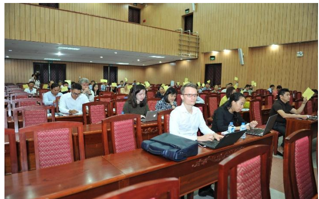
Cổ đông giơ phiếu biểu quyết